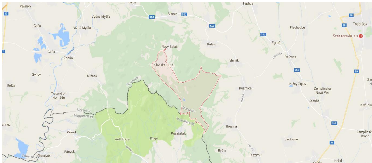
Obrázok 1 Mapa polohy obce Slanská Huta

Obec Slanská Huta sa nachádza v Košickom kraji v juhovýchodnej časti okresu Košice – okolie. Kataster obce leží v južnej časti Slanských vrchov v odlesnenej eróznej kotline potoka Terebľa vo výške 275-750 m n.m. so stredom obce v 460 m n.m. V juhovýchodnej časti katastra obce je jazero Izra s rozlohou 3,7 ha. Obec sa nachádza na odbočke z cesty II. triedy číslo 552, ktorá je spojnícou z Košíc smerom na Zemplín a Tokaj. Podnebie je mierne vlhké a mierne teplé.